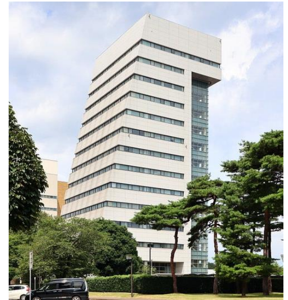
20周年記念棟 6階 メディカルシュミレーションセンター